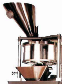
Dosificador volumétrico Mod. FMV