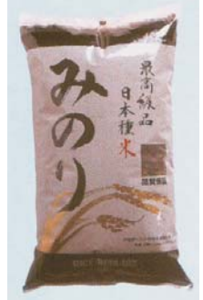
Envases Mod. FV - 60 PLUS