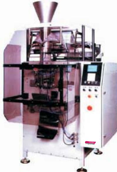
Mod. FV - 60 PLUS