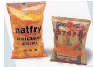
Envase Mod. FV - 80

Las envasadoras Mod. FV disponen de accionamiento mecánico-electrónico con microprocesador y pantalla display de 14 líneas de cuarzo, además Los Mod. FV - 80 y FV - 60 PLUS cuentan con desenrollador de bobina automático y accionamiento de correas por servo-mecanismo.