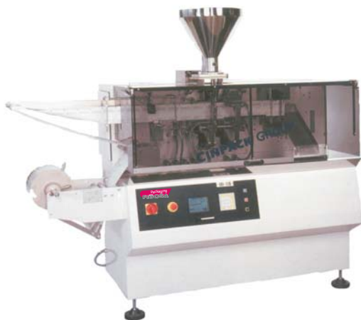
Mod. FH - 100