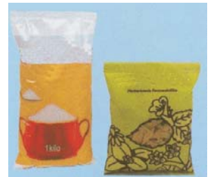
Envase Mod. FV - 60