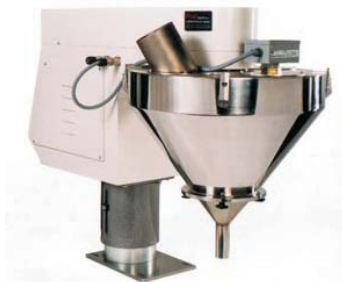
Dosificador sin fin Mod. FDV

Las envasadoras Mod. FV disponen de accionamiento mecánico-electrónico con microprocesador y pantalla display de 14 líneas de cuarzo, además Los Mod. FV - 80 y FV - 60 PLUS cuentan con desenrollador de bobina automático y accionamiento de correas por servo-mecanismo.