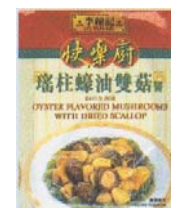
Envase Mod. FH - 140