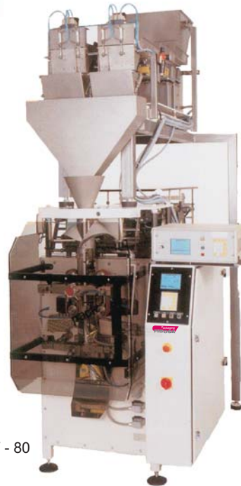
Mod. FV - 80