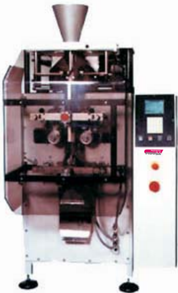
Mod. FV - 60

Las envasadoras verticales FIBPACK Mod.FV, forman las bolsas partiendo de bobina, las llenan y cierran automáticamente.