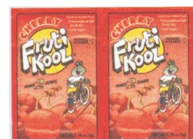
Envase Mod. FH - 100