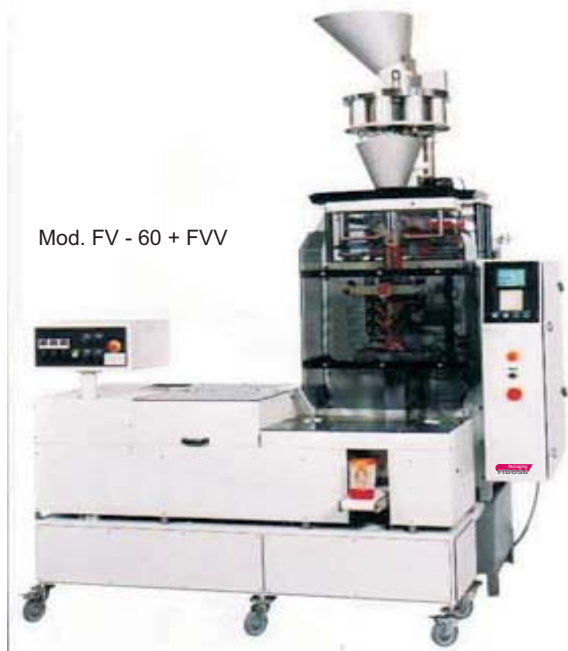
Mod. FV - 60 + FVV