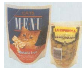
Envase Mod. FH - 170