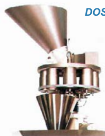
Dosificador volumétrico Mod. FVV