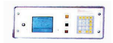
Pesadoras lineales Mod. FP-1 y FP - 2